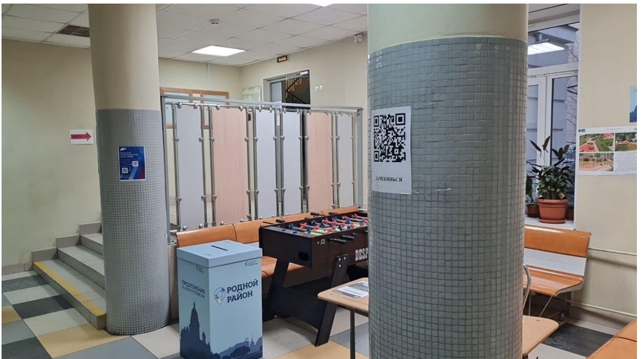
Подход к УИК 2201